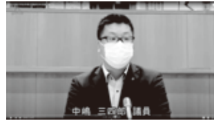
箕面市議会令和2年第2回臨時会本会議(第1日)